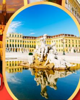
พระราชวังเซ็นบรุนน์